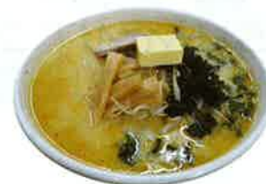
味噌カレー牛乳ラーメン